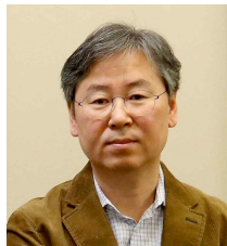
이 원 섭 회장 국토연구원

학회의 재정은 회원 여러분의 적극적인 지원으로 위기를 넘기고 안정화 단계에 들어선 것으로 생각됩니다. 금년도의 회비 징수 실적은 학회 설립 이래 최고를 기록하였습니다. 학술대회를 후원해 주신 관계기관, 그리고 연구용역을 통해